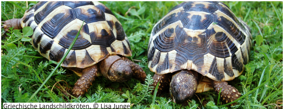
Griechische Landschildkröten.

Der Bodengrund sollte aus Blumenwiese, Sand, Schotter und Lehmerde bestehen. Kleine Büsche, Stauden, Wurzeln, Steine, eine Wasserstelle sowie ein Hügel zur Eiablage sind für eine vielfältige Strukturierung notwendig.